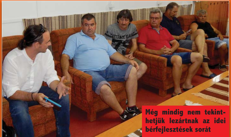
Még mindig nem tekinthetjük lezártnak az idei bérfelesztések sorát

Augusztus utolsó hetének elején tartotta a Záhonyi Terület szokásos évi oktatását és összetartását a berekfürdői VSZ-üdülőben. Kint hóhullám, bent parázs viták jellemezték a találkozózt, és ismét megbizonyosodtunk arról, hogy csak mindent megvitatta, átbeszélve lehetünk úrrá a problémákon: minden véleményt és célt egyeztetni kell a jövő érdekében. A magunk részéről meg is tettünk mindent, mert jól tudjuk, országosan is csak együtt, összetartva lehetünk eredményesek.