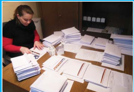
Ilyen sokan csatlakoztak hozzánk 2014 januárban