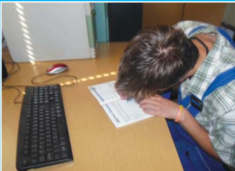
Egy új belépő a sok közül

A VSZ szervezettsége és taglétszáma is hosszú idő óta nem romlik, hanem évről évre javul, ami pozitív hatással van az érdekvédelmi munkánkra is. A VSZ számos olyan érdekvédelmi eredményt tudhat magáénak, amely bizonyítja az összefogás erejét. A tagkártyával elérhető szolgáltatásainkat folyamatosan bővítjük a tagok igényeinek figyelembe vételével. Ennek eredményeképpen már a vasúti szektorban és azon kívül is nagy elismeréssel szólnak a társszervezetek ezen irányú munkánkról.