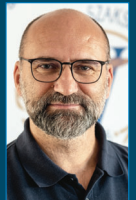
Zlati Róbert írása a Népszavának

Egyértelmű: a szakszervezeteknek újra ki kell találniuk magukat, s mindenki számára hiteles, tartalmas, minőségi működést kell kínálni. Ez a mi dolgunk, szakszervezeti vezetőké. Ezzel párhuzamosan azonban meg kell harcolni a potyautas szindróma megszüntetéséért, mert az is gúzsba köti a mozgalmat. Amíg többen vannak kint, mint belül, addig nem lehetünk erős, tömegeket megmozgató, potyautas kérdést is kezelni képes szervezet.